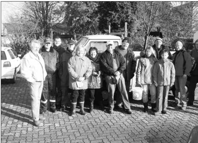
Fleißige Helferinnen und Helfer bei der Aktion „Saubere Landschaft“.

Ein Anhänger voll achtlos weggeworfener Müll bzw. beim Autofahren aus dem Fenster geworfener Abfall wurde von fleißigen Händen gesammelt. Danke auch an unsere Feuerwehr für die anschließende Bewirtung mit Eintopf, Getränken und Kaffee.