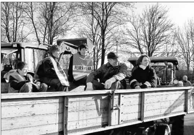
Startklar zum Ausrücken: Die Helfer der Aktion „Saubere Landschaft“.