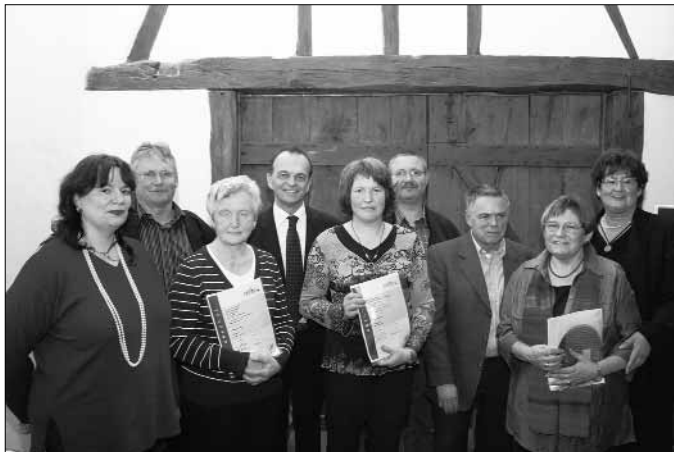
Das Foto zeigt die Besitzer der ausgezeichneten Ferienwohnungen der Verbandsgemeinde Lingenfeld.