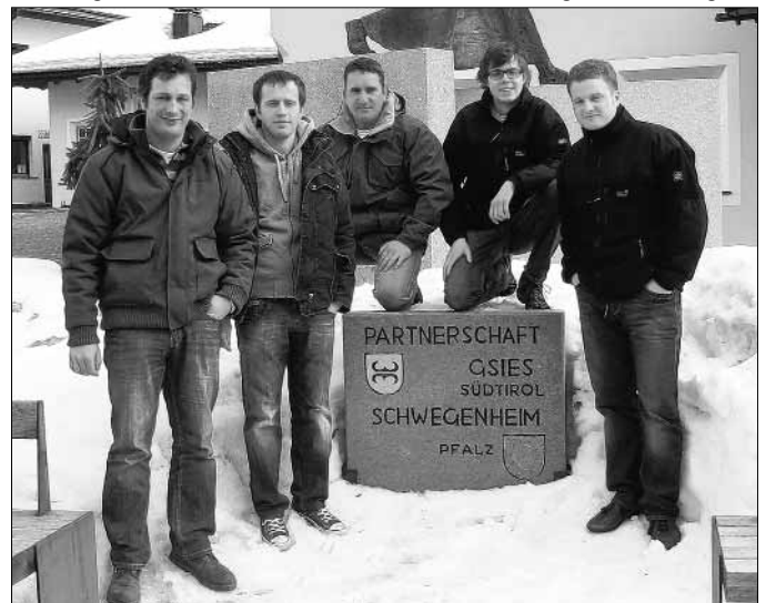
Nahmen erfolgreich beim „Muispfunrenn“ in unserer Partnergemeinde der Pichl/Gsies teil:

„Gestartet wurde bei Kaiserwetter auf einer ausgezeichnet präparierten Piste in vier Kategorien. Während die Regeln, was die Art und Weise, wie die Piste bewältigt werden musste, recht tolerant waren - Pfanne und Mensch mussten gemeinsam ins Ziel kommen - waren die Organisatoren beim Untersatz sehr streng: nur originale Muspfanren waren zugelassen. Wer selbst keine Muspfanne mehr daheim hatte, konnte sich eine leihen.“ Gerüchten zufolge soll in den Tagen vor dem Rennen in den Küchen des gesamten Gsiesertals keine einzige Muspfanne mehr zu finden gewesen sein. In der Mannschaftswertung sicherten sich die Schwegenheimer einen stolzen 2. Platz und 100 Euro Preisgeld. Gratulation - auch von Seiten der Ortsgemeinde! shg