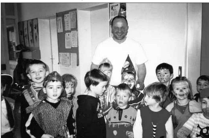
Das Team der Kita Taka-Tuka-Land