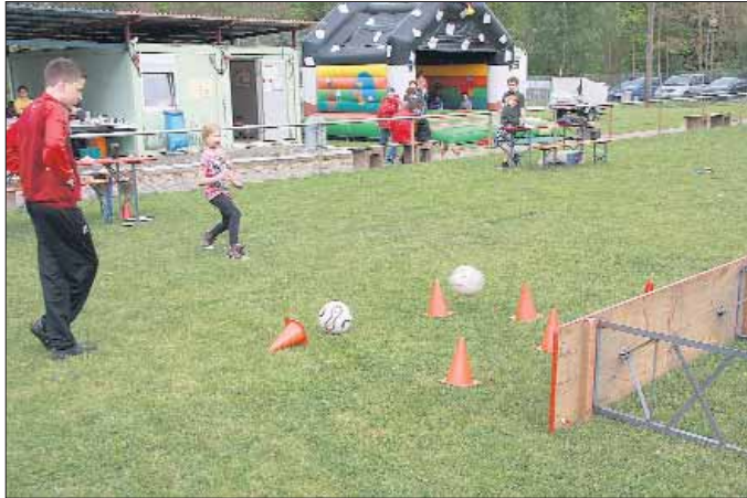
Weitere Informationen unter www.tv-westheim.de

Unser Sportheim, die Waldschänke ist wie folgt geöffnet: Mittwoch bis Samstag ab 14 Uhr und Sonn- und Feiertag ab 11 Uhr