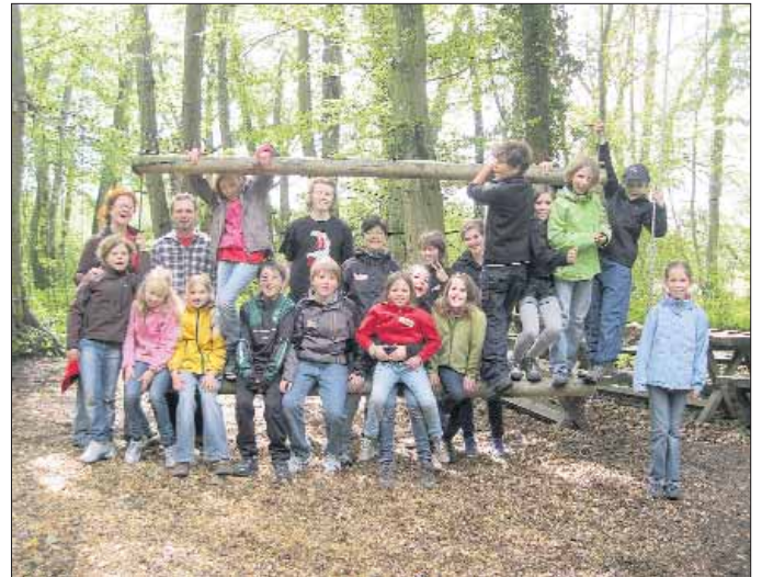
NAJU vor dem Kletterabenteuer