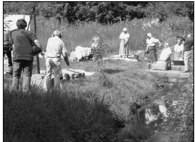
„Aktion“! Das Filmteam Beckmann und die Lingenfelder Waschfrauen

Am Samstag, den 10. Juli 2010 ging es heiß her an der „Duchbläch“: