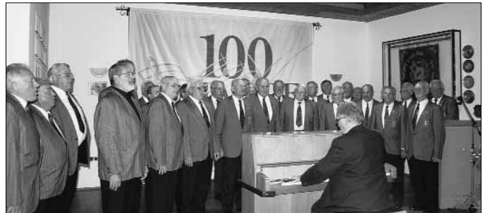
Der Männerchor bei seinem Festbankett

Festlich geschmückt war die große Hochwaldhalle in Hermeskeil, als unter der Schirmherrschaft des Landesmusikverbandes und im Beisein von Sängerpräsident Hartmut Doppler in einer zentralen Feier für ganz Rheinland-Pfalz Kulturstaatssekretär Walter Schumacher auch an drei Pfälzer Chöre die begehrte Zelterplakette überreichte, darunter auch an den MGV Einigkeit Lingenfeld.