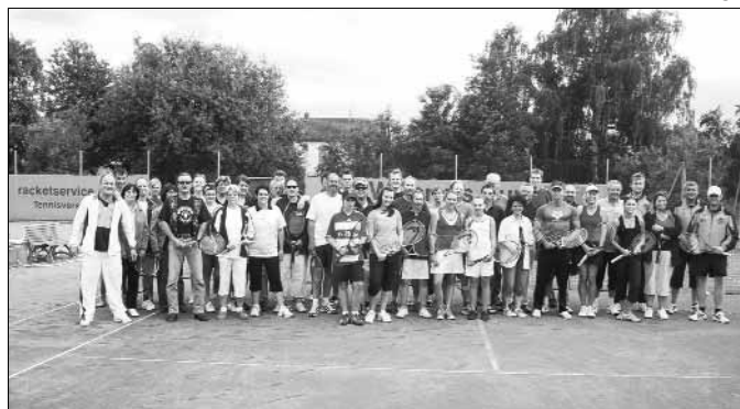
Der Wettergott meinte es überaus gut mit dem zum zweiten Mal ausgetragenen Tennisturnier des Tennisclubs Lustadt unter dem Motto „Unser Dorf spielt Tennis“.