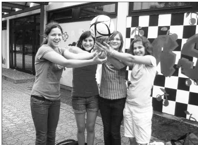
Sie kamen, sahen und siegten.....

Schwegenheim nahm zum ersten Mal am Konfirmanden/innentag teil und startete voll durch.