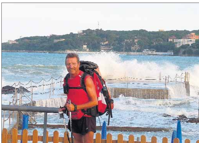
„Bin zum jetzigen Zeitpunkt (13.07.) kurz hinter Pisa. Das Wetter ist sehr schön - so schön heiß, das ich morgens um 5 Uhr meinen Wan-