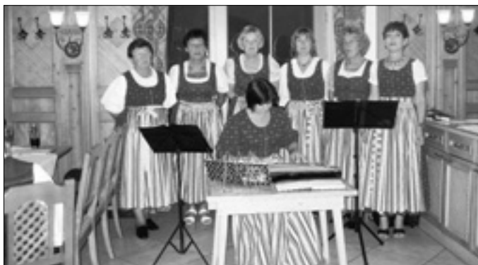
Frauensingkreis aus Großkaro