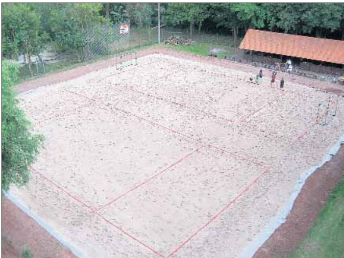
Es sind zwar noch nicht alle Arbeiten abgeschlossen, aber interessanten und vielleicht auch spannigen Spielen steht nichts im Weg. Am

Auch wenn einige nicht mehr mit der Premiere unseres Handball-Dorfturniers im Sand gerechnet haben, wir können allen sagen, es ist geschafft! Pünktlich eine Woche vor der Wiederauflage unseres Turniers ist der Riesensandkasten gefüllt.