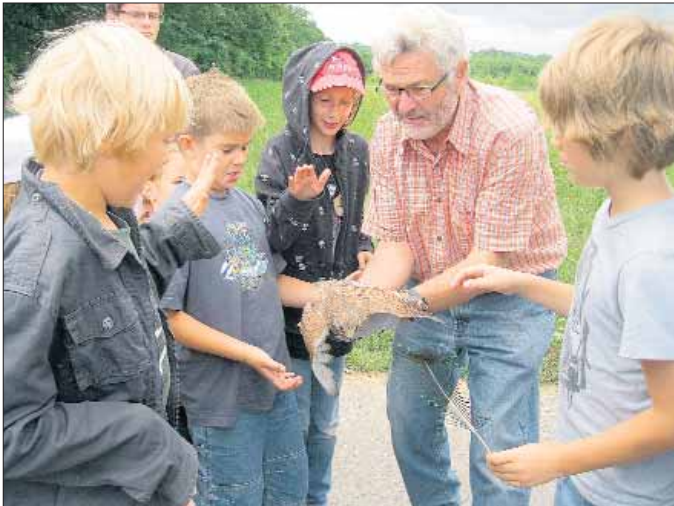
Live dabei: ein Turmfalke wird ausgewildert

Tagesfreizeit „NAJU Kinderakademie Natur“ für 40 naturbegeisterte Kinder