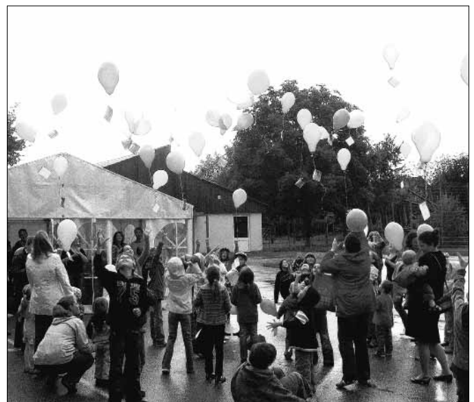
Am vergangenen Freitag feierten wir unseren 5-jährigen Geburtstag auf dem Schulhof der Grundschule Westheim.