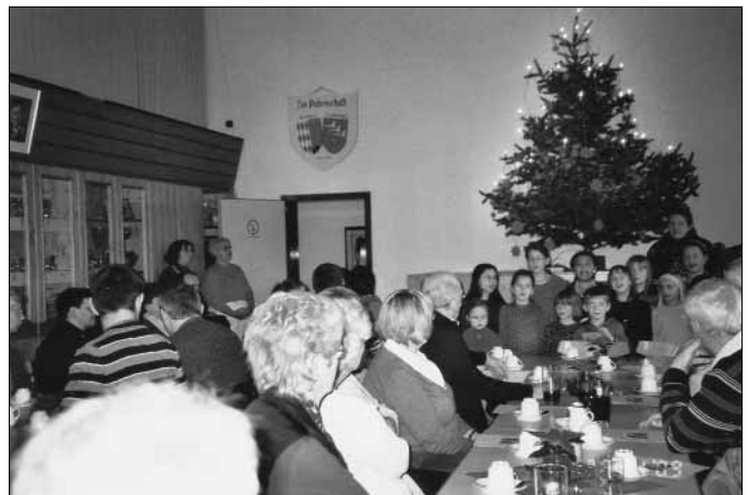
Auftritt der „Waldkehlchen“

dieses Jahr erfreute uns auch wieder der Kinderchor die „Waldkehlchen“. Wir bedanken uns auf diesem Wege noch einmal recht herzlich für alle Darbietungen, die uns sehr gefielen und zur Besinnung auf Weihnachten einstimmten. Außerdem bedanken wir uns bei den Kuchenbäckerinnen, den Helfer und Helferinnen, den Spendern und allen, die zum Gelingen dieses angenehmen Nachmittags beitrugen. Ebenso sei der Gemeinde für die Überlassung des kleinen Saales im Bürgerhaus gedankt!